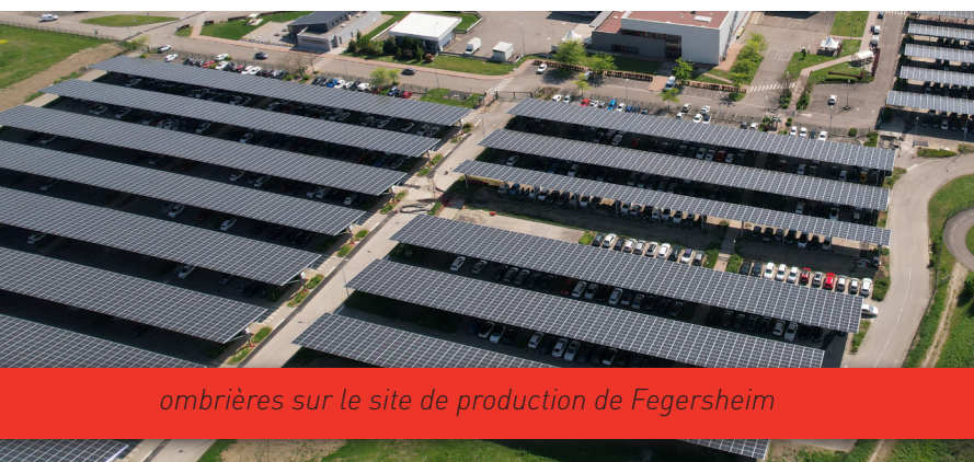
ombrières sur le site de production de Fegersheim

A ce jour, le site français dispose déjà de près de 2 000 m 2 de panneaux solaires répartis sur différents bâtiments du site. Les 20 000 m 2 de panneaux supplémentaires, placés sur ombrières , recouvrent désormais le parking du site de production protégeant par là-même les voitures des collaborateurs du soleil l'été et de la pluie en toutes saisons. Représentant une puissance installée de 4,2Mw c * (mégawatt crête*), ils permettront au site de produire directement 12% de sa consommation en électricité, le complément en électricité verte provenant de son fournisseur d'énergie.