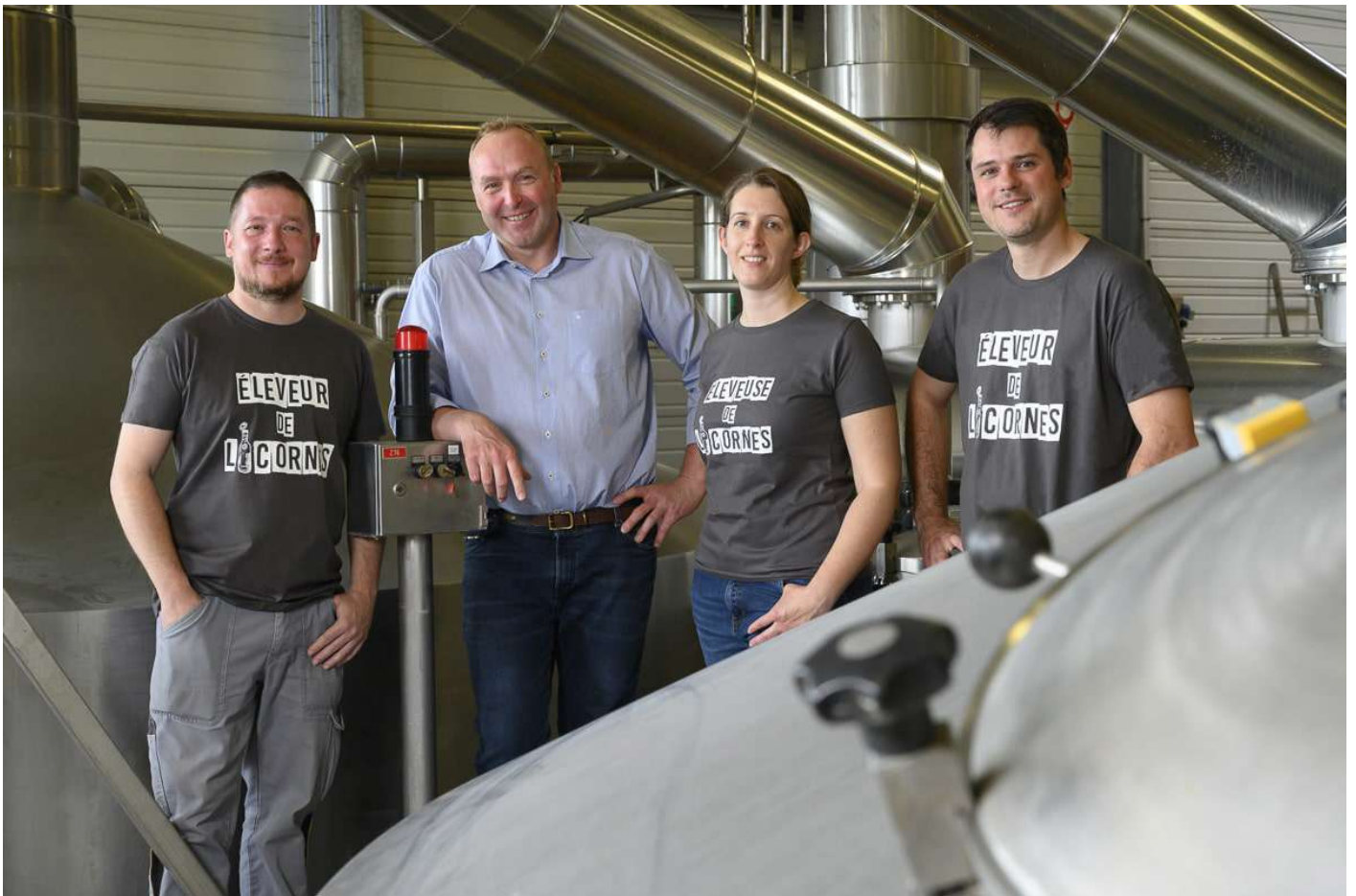
L'équipe RSE de Brasserie Licorne.

Pour les années à venir, Brasserie Licorne s'est fixé des objectifs clairs et ambitieux. L'établissement vise à réduire, d'ici à 2025, de 30 % sa consommation en eau et de 20 % celles de gaz et d'électricité. Pour tenir ses résolutions, l'entreprise a déjà posé de nombreux jalons. Dernier exemple en date, l'installation d'un osmoseur en entrée de chaudière vapeur.